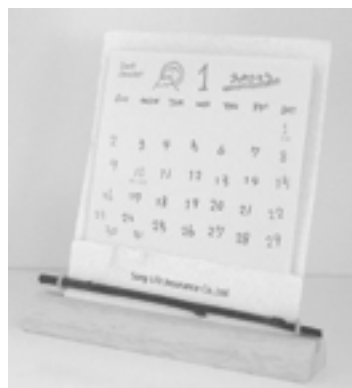
昨年プロジェクトで作成されたカレンダーの一例

作成するカレンダーは昨年同様、ぬくもりのある手づくり風と実用性重視の2パターンが主力で、デザインについてはデザイン委員会を設置し、昨年のデザインをベースに若干リニューアルしていく方向です。