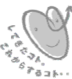
震災10年神戸からの発信