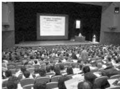
1月19日に行われた緊急集会の様子

去る1月19日に行われたグランドデザインに対する緊急集会では、短期間の準備にもかかわらず700名の当事者、家族、施設・作業所関係者、医療関係者が集まり関心の高さがうかがえました。それぞれの想いを聴き、障害ある人たちが生き生きと豊かに生活出来る社会の実現に向けて、今後も学び議論を深めていくことへの共通認識を持つことが出来ました。